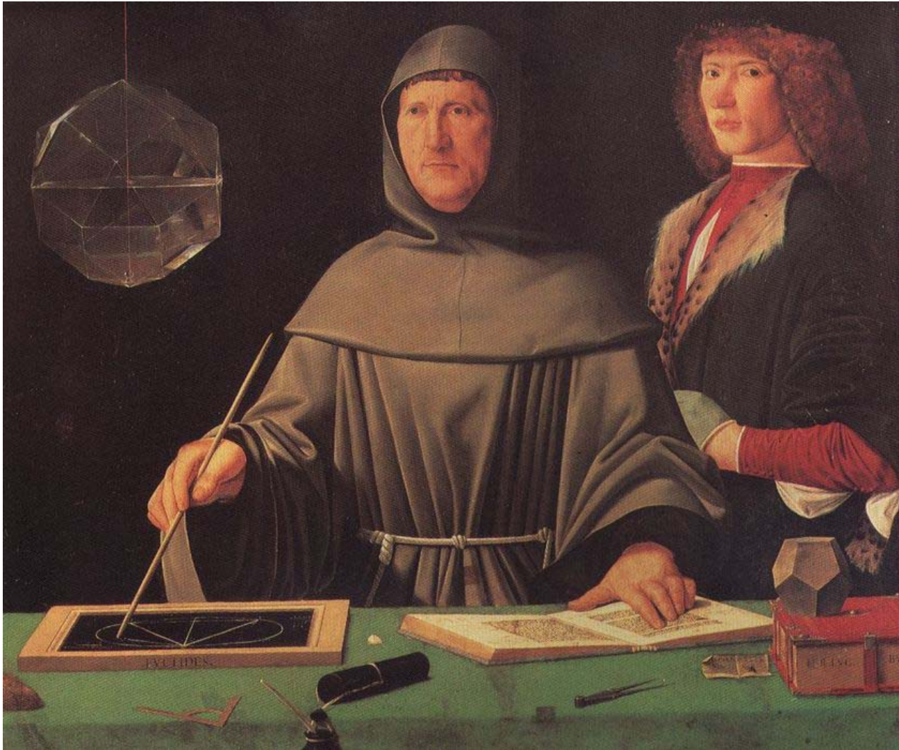
Luca Pacioli, 1495